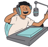
Initiation à la radio amateur