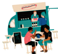
Restauration sur place