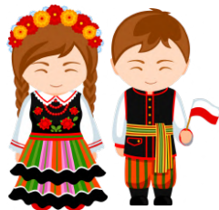
Initiation à la culture polonaise