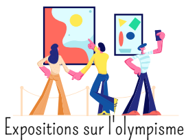
Expositions sur l'olympisme