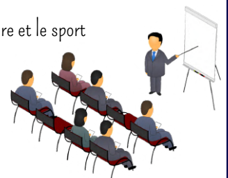
Conférence sur l'histoire et le sport