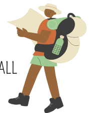
Randonnées culturelles by CALL