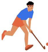
Hockey sur Gazon