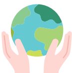
Atelier sur le tri des déchets